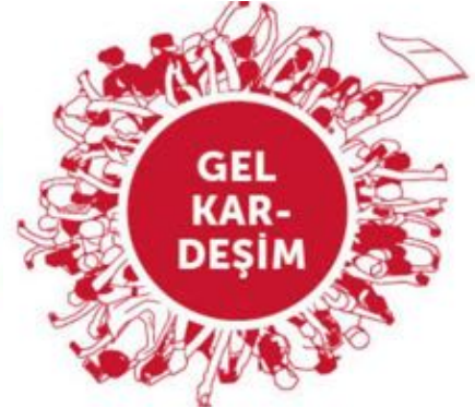
2000li yılların TİP'i