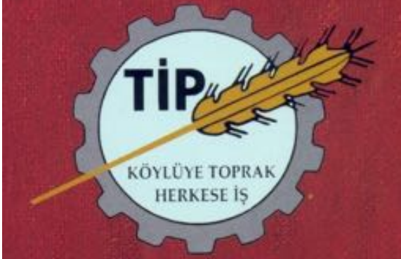
60lı yılların TİP'i